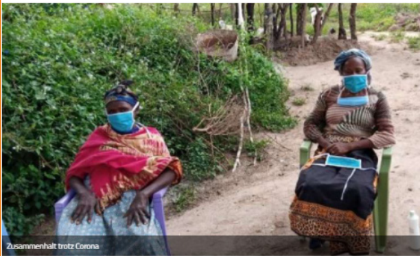
Zusammenhalt trotz Corona

Laura Lindtner, REPORTER , 08.02.2021 13:25 Uhr